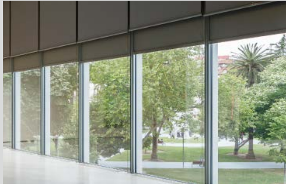
©Fundacion Botin - Centro Botin - Arquitecto Renzo Piano - Santander 2017 - Resstende Srl - Mermet SAS